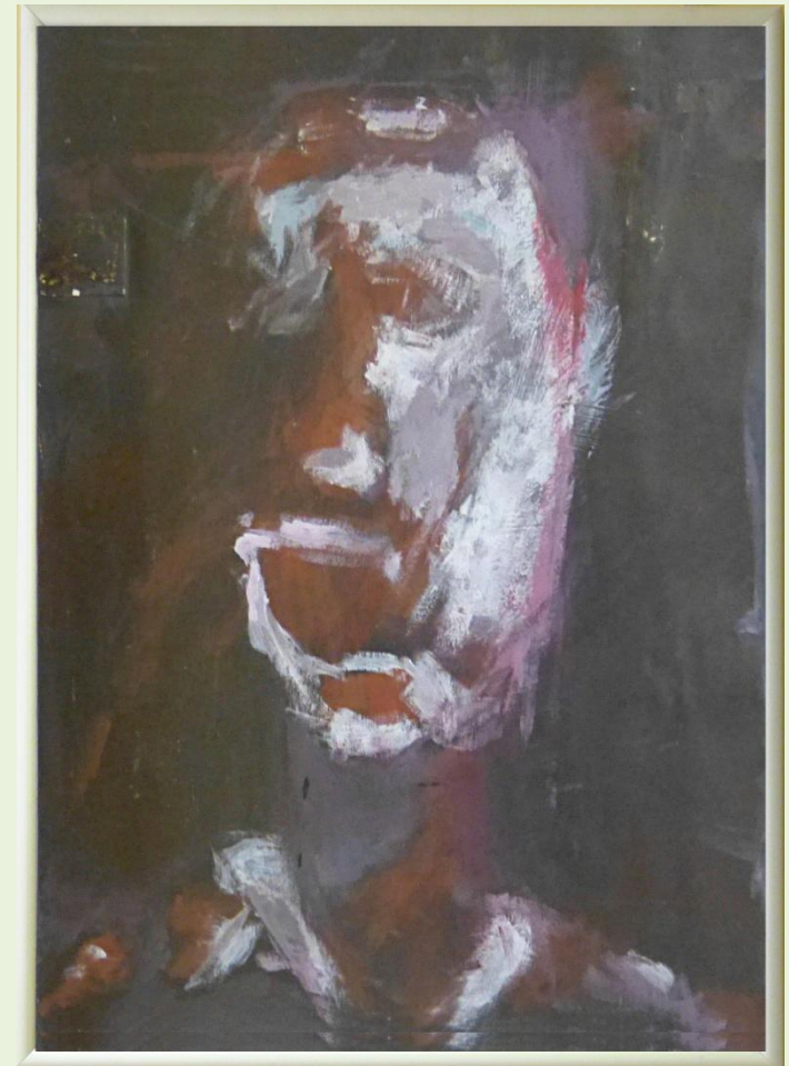
Schodkowa Galeria w DBP. Luty 2014 r.