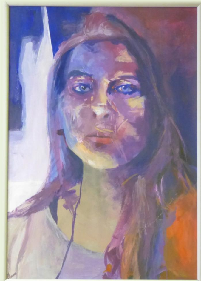
Schodkowa Galeria w DBP. Luty 2014 r.