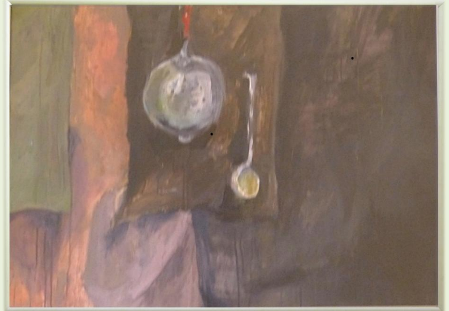
Schodkowa Galeria w DBP. Luty 2014 r.