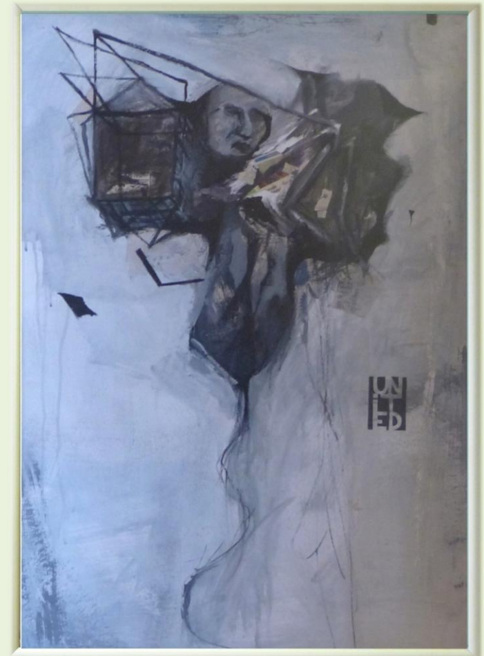
Schodkowa Galeria w DBP. Luty 2014 r.