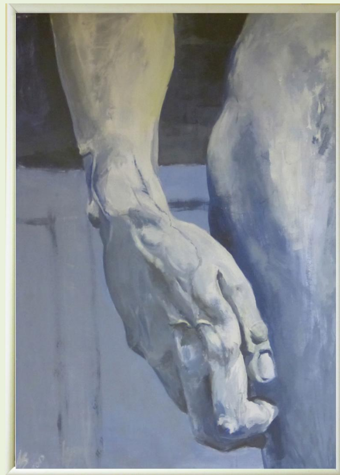
Schodkowa Galeria w DBP. Luty 2014 r.