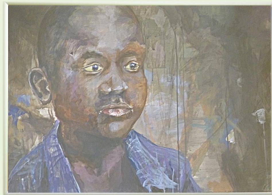
Schodkowa Galeria w DBP. Luty 2014 r.