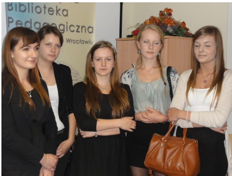
Laureatki nagrody głównej - uczennice LO w Górze