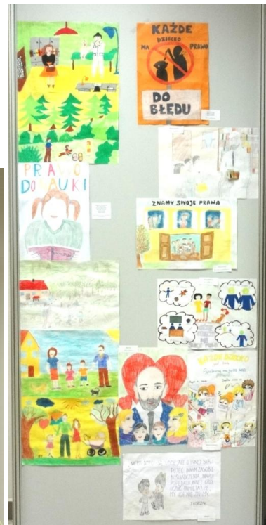
Zaproszenie na wystawę